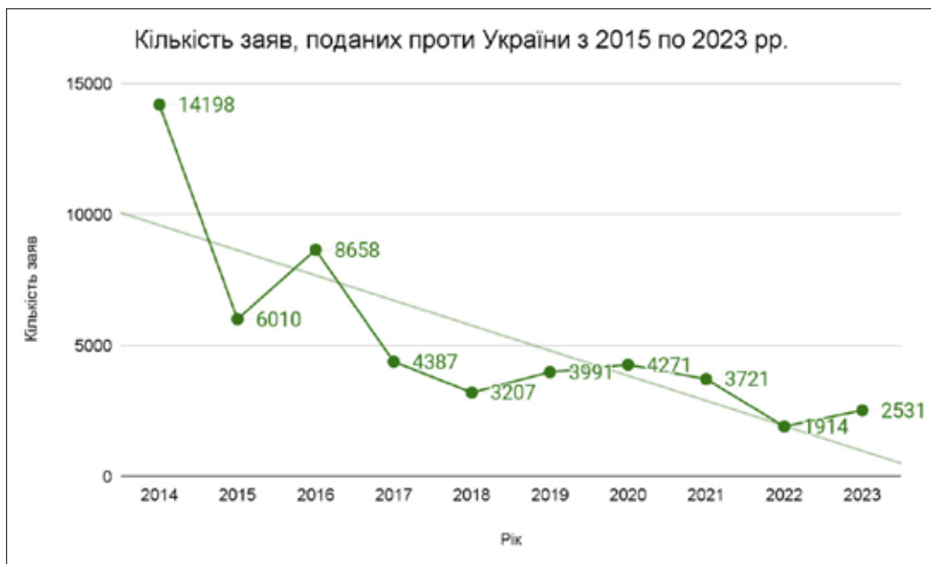
Рис. 1. Тенденція кількості поданих до ЄСПЛ заяв проти України у 2014–2023 рр.

Відповідно до ст. 1 Закону України «Про виконання рішень та застосування практики Європейського суду з прав людини» до судових рішень ЄСПЛ відносяться «а) остаточне рішення Європейського суду з прав людини у справі проти України, яким визнано порушення Конвенції про захист прав людини і основоположних свобод; б) остаточне рішення Європейського суду з прав людини щодо справедливої сатисфакції у справі проти України; в) рішення Європейського суду з прав людини щодо дружнього врегулювання у справі проти України; г) рішення Європейського суду з прав людини про схвалення умов односторонньої декларації у справі проти України» [4]. При цьому ст. 18 даного Закону уточнює, що разом із рішеннями до практики ЄСПЛ відносяться також ухвали даного суду (ст. 18).