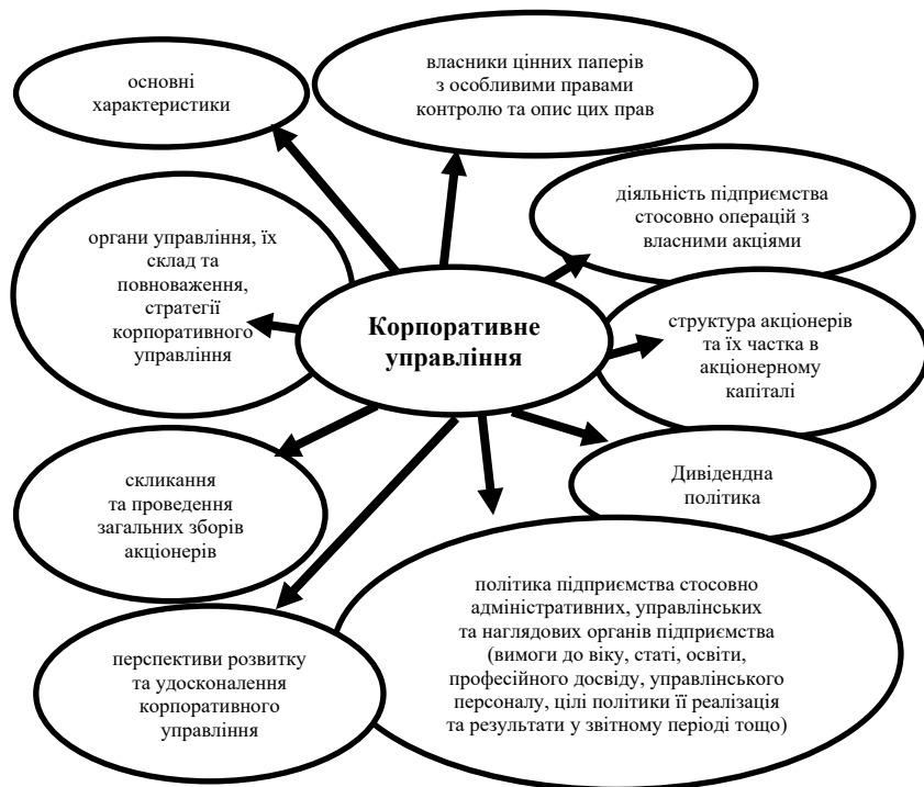
Рис. 1. Рекомендовані інформаційні блоки за напрямом «Корпоративне управління»

розвитку економічних суб'єктів, що обумовлює необхідність перегляду методологічних підходів до обліку людського капіталу, прав інтелектуальної власності, інноваційної діяльності та її результатів тощо. Суб'єкти господарювання при розробці облікової політики мають враховувати ці аспекти. Обстеження регламентів з облікової політики та проведення опитування посадових осіб, що відповідають за її формування та є її користувачами, дає підстави стверджувати, що має місце нерозуміння необхідності трансформацій обліку та орієнтацію обліку більшості суб'єктів господарювання виключно на формування і подання звітності, зокрема фіскальної та фінансової. Відповідно, зміна формату звітності та поширення необхідності інтегрованої звітності на суб'єкти малого і середнього бізнесу потребують формування нових підходів до підготовки фахівців з обліку, оподаткування, аудиту та фінансів.