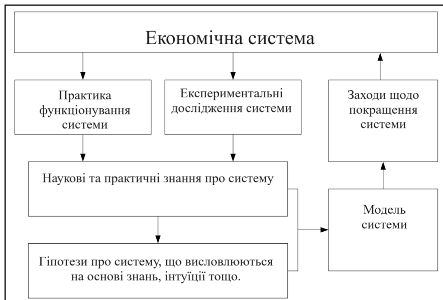
Рис. 2. Роль моделювання у розвитку економічної системи

таких моделей не можна визначити точно. На їх значення впливає «людський фактор», тому що вони є результатом дій та рішень багатьох окремих людей, які в однаковій ситуації поведуться по-різному. В результаті характеристики економічних моделей виявляються випадковими величинами, згрупованими навколо яких то середніх значень чи середніх залежностей. Такі моделі називаються стохастичними (на відміну детермінованих моделей, характеристики яких жорстко задані).