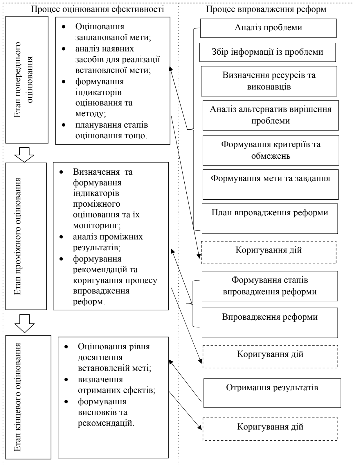
Рисунок 2. Алгоритм оцінювання ефективності реформ (сформовано автором із використанням джерел [3, 11, 12, 14, 15])