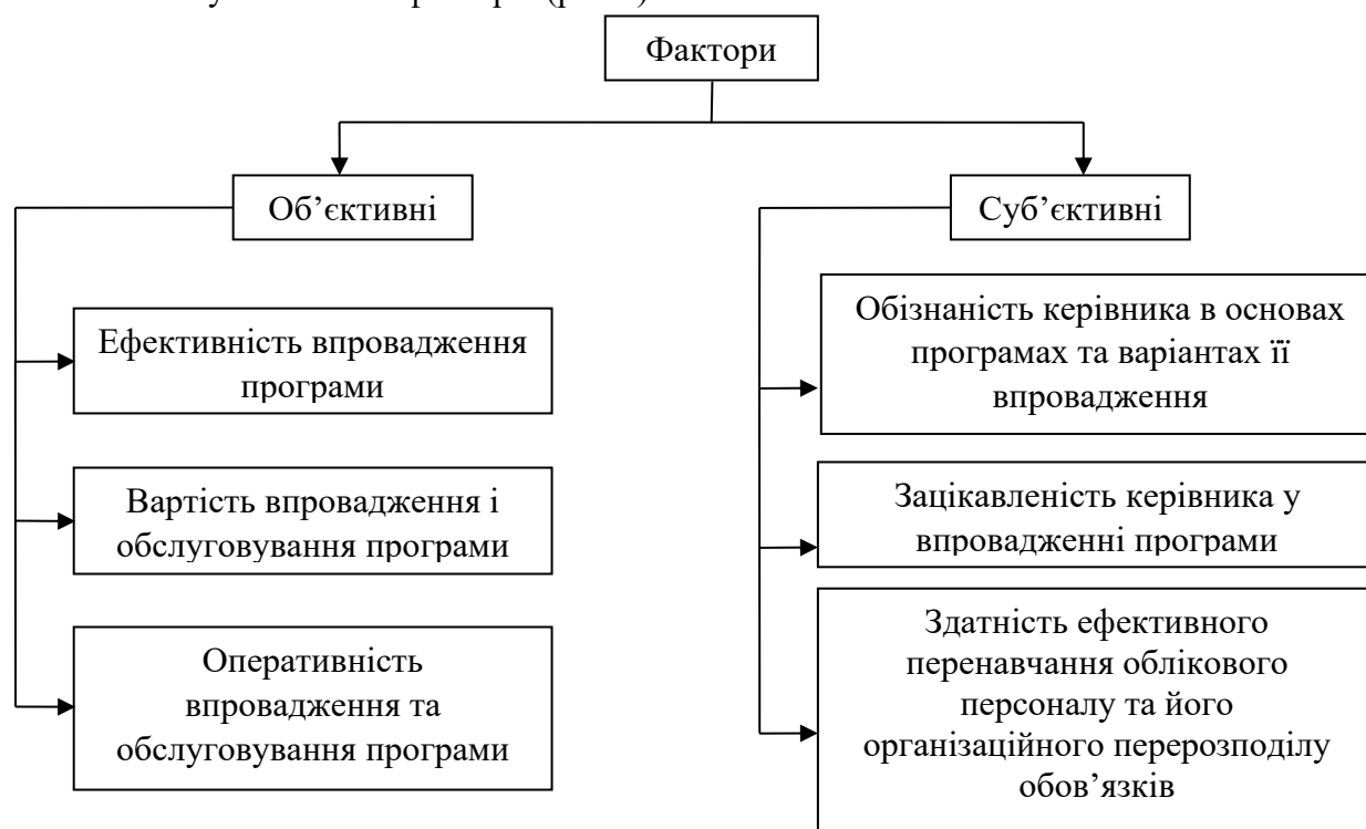
Рис. 2. Фактори, від яких залежить прийняття рішення про впровадження Agri: бухгалтерія керівником підприємства

Для впровадження програми Agri: бухгалтерія потрібно враховувати гарантійні зобов'язання при експлуатації, можливе виникнення помилок, обслуговування та доналагоджування з метою виправлення виявлених недоліків. Проводити періодично аналіз функціонування, оновлення у зв'язку зі змінами законодавства та прийняття рішення про необхідність впровадження програми в облікову службу фермерського господарства. Таке рішення приймає власник або голова фермерського господарства, і залежить воно від низки об'єктивних і суб'єктивних факторів (рис.2).