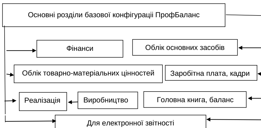
Рис. 1. Основні розділи базової конфігурації ПрофБаланс