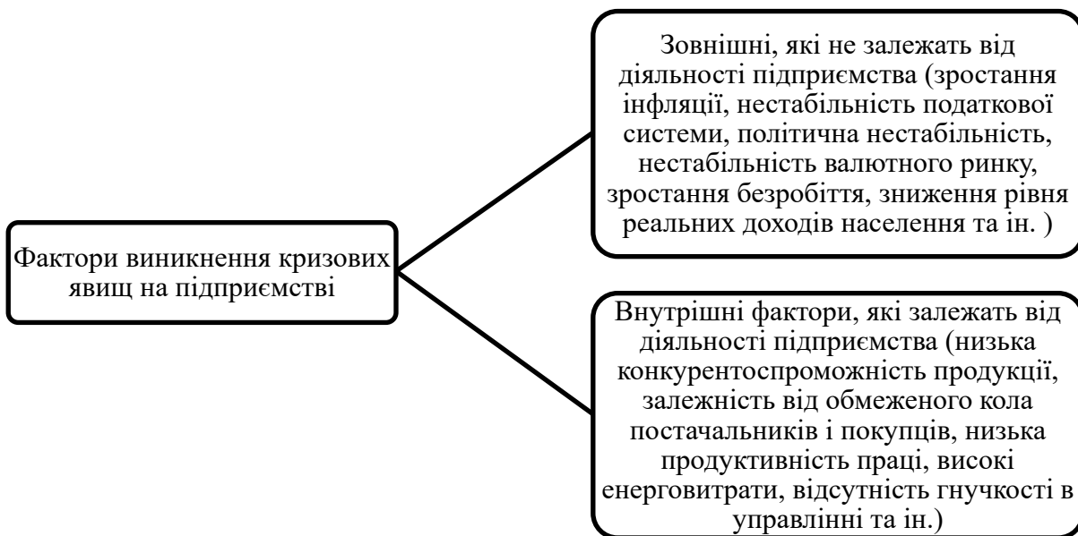
Рис. 1. Фактори виникнення кризових явищ на підприємстві [4, с. 74-79]

Виникнення кризових явищ на підприємстві спричиняють як зовнішні, так і внутрішні фактори (рис. 1).