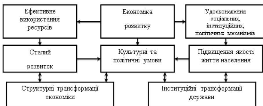
Рис. 2. Механізм функціонування економіки розвитку

У результаті нейропрогнозування, проведеного В.І. Пічурою [11], встановлено, що в ґрунтах сухостепової зони під час використання існуючих агротехнологій прогнозується процес поступової дегуміфікації, зокрема на богарних землях – на 0,01 %/рік, на зрошуваних – на 0,03 %/рік, та скорочення площ земель, що характеризуються середнім і підвищеним умістом гумусу. Таким чином, підтверджується актуальність проблеми збереження і підвищення вмісту гумусу в ґрунтах. Варто зазначити, що баланс гумусу суттєво залежить від структури посівних площ, оскільки різні види рослин неоднаково впливають на поповнення запасів гумусу. У польових сівозмінах коефіцієнт гуміфікації органічних решток коливається в межах від 0,10–0,13 (цукрові буряки, соняшник) до 0,23–0,25 (горох, вика, соя, люцерна, еспарцет). Отже, мінімальні показники мають рослинні рештки