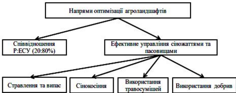
Рисунок 1. Основні напрями оптимізації агроландшафтів Східного Поділля

З метою збереження біорізноманіття та враховуючи структуру земельного фонду регіону пропонуються такі напрями оптимізації агроландшафтів, як оптимальне співвідношення ріллі до екологостабілізаційних угідь (ЕСУ) та ефективне управління сіножаттями і пасовищами (рис. 1).