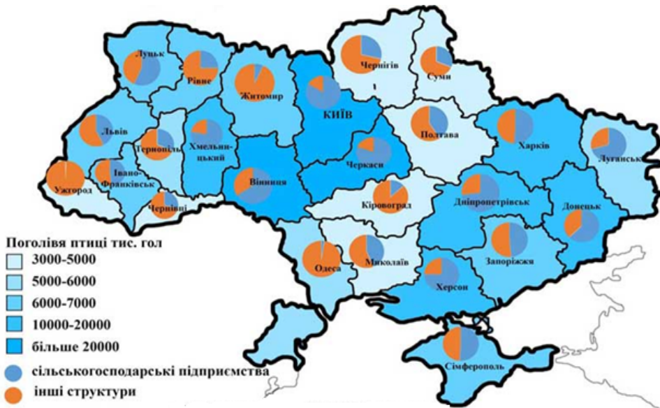
Рисунок 1 - Чисельність поголів'я птиці в Україні по областях станом на 1 січня 2015 року

Лідерами за нарощуванням чисельності поголів'я сільськогосподарської птиці в усіх категоріях господарств України станом на 1 січня 2015 року в порівнянні з 2014 роком є Вінницька (16%), Херсонська (14%) і Волинська (8,6%) області України. Негативні показники в Донецькій ( - 42,2%), Луганській ( - 35,8%), і Миколаївській ( - 23,2%) областях України. Загальний показник по країні, в сумі по областях з позитивною динамікою нарощування поголів'я сільськогосподарської птиці, склав 10,9% по відношенню до аналогічному періоду минулого року. Сумарний негативний показник по областях України, де відбулося зменшення поголів'я птиці, склав 13,1% відносно аналогічного періоду минулого року. В цілому по Україні поголів'я сільськогосподарської птиці всіх видів у всіх категоріях господарств станом на 1 січня 2015 року зменшилось на 2,2 % по відношенню до аналогічному періоду 2014 року [2, 6, 8].