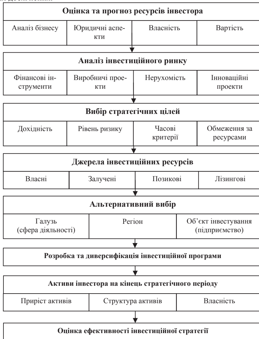
Рисунок 1. Схема формування інвестиційної стратегії

Результати досліджень. Інвестиційна стратегія є довгостроковим узагальненим планом управління капіталом [6]. Вона обирається відповідно до стану та прогнозів щодо макроекономічного середовища, інвестиційного ринку, самого інвестора, сфери його бізнесу та ділових інтересів. Інвестиційна стратегія – це довгостроковий план, система концептуальних цілей і важелів для їх досягнення.