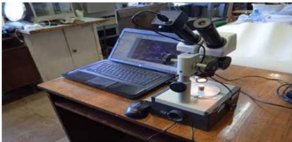
Fig. 1. Optical-digital unit for fractographic studies