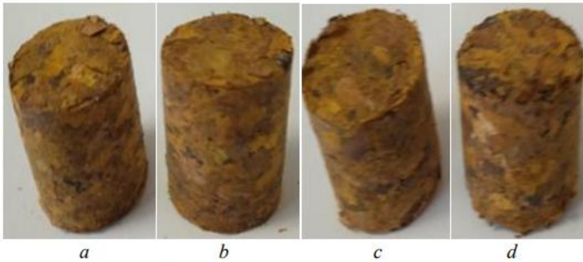
Fig. 2. General view of pellet samples (diameter 16 mm) made from a mixture of OSW and maple leaves, the content of which is respectively: a, b (30/70%); c, d (50/50%); a, c – pressure 130.5 MPa; b, d – pressure 217.5 MPa