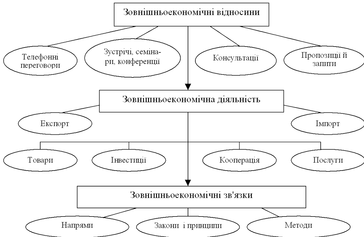
Рис. 1. Система взаємопов'язаних понять “зовнішньоекономічні відносини”, “зовнішньоекономічна діяльність”, “зовнішньоекономічні зв'язки”

Так, у США до 60 % продукції, виробленої фермерами, реалізується по регульованих каналах збуту, по контрактах із визначенням термінів поставок, їх обсягів і попередньо обумовленої ціни. Інший канал реалізації зерна – фермерські кооперативи, де також виключена стихія ринку.