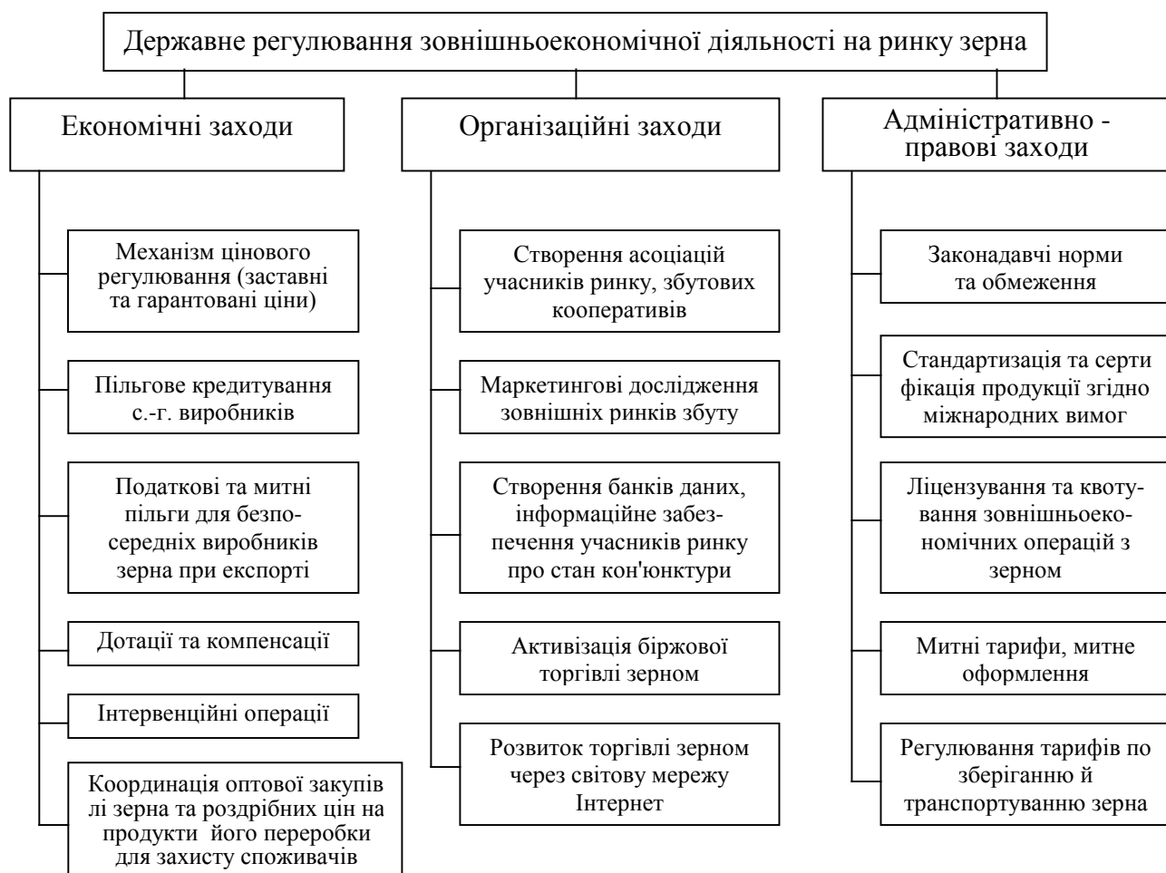
Рис. 3. Система заходів державного регулювання зовнішньоекономічної діяльності на ринку зерна

експортерів зерна, метою діяльності якої буде забезпечення інтересів своїх членів – товаровиробників, зможе розв'язати існуючі проблеми й підвищити прибутковість зернового господарства. Учасники асоціації зберігають юридичну та господарську самостійність і співпрацюють на принципах взаємних економічних інтересів.