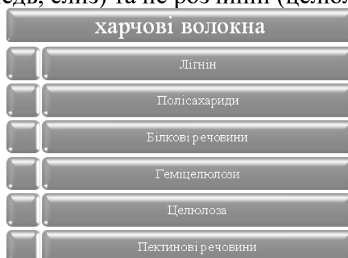
Рисунок 1 – Класифікація харчових волокон

Харчові волокна (клітковина) – це природний компонент їжі, який стійкий до дії амілази та інших ферментів, не перетравлюється ендогенним шлунково-кишковим секретом і не всмоктується в тонкому кишечнику, впливаючи на процеси перетравлення і всмоктування поживних речовин [1]. Харчові волокна дуже корисні для організму людини, їх ділять на розчинні (пектин, камедь, слиз) та не розчинні (целюлоза, лігнін).