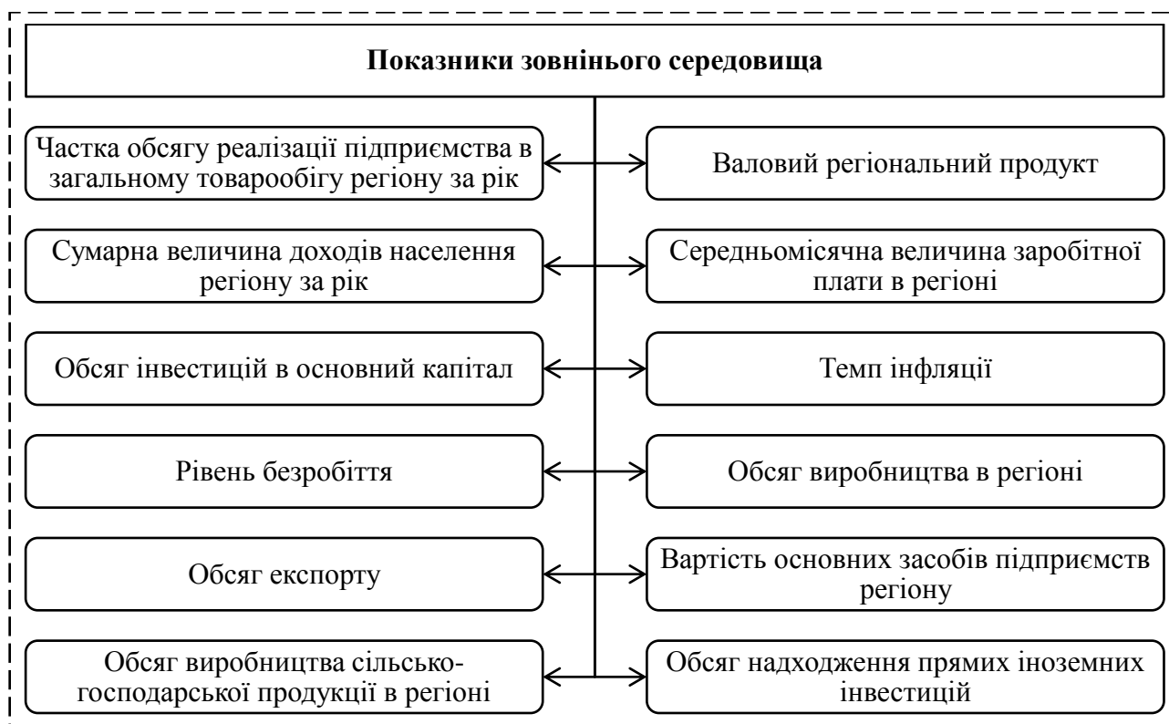
Рис. 2. Показники зовнішнього середовища [6].

Між значеннями доходів підприємства та показників зовнішнього середовища існує пряма пропорційна залежність – зі зростанням показників зростають доходи, окрім рівня безробіття, в даному випадку простежується обернена пропорційна залежність – зі збільшенням рівня безробіття зменшуються доходи населення, що впливає на зниження їх покупної спроможності, що, в свою чергу, впливає на зниження величини доходів від реалізації.