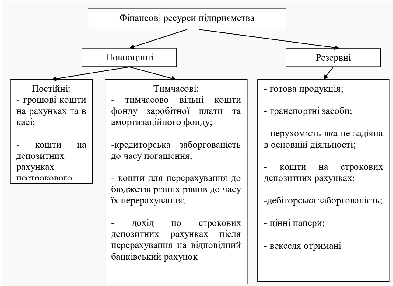
Рис. 2. Класифікація фінансових ресурсів підприємств

Так Рибалко Н. О. пропонує наступну класифікацію фінансових ресурсів суб'єкта господарювання яка наведена на рисунку 2.