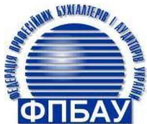
Федерація професійних бухгалтерів та аудиторів України

МІНІСТЕРСТВО ОСВІТИ І НАУКИ УКРАЇНИ ПОЛТАВСЬКИЙ ДЕРЖАВНИЙ АГРАРНИЙ УНІВЕРСИТЕТ ДЕРЖАВНА ВИЩА ПРОФЕСІЙНА ШКОЛА В КОНІНІ (М. КОНІН, ПОЛЬЩА) ІНЖИНЕРНИЙ НАВЧАЛЬНО-НАУКОВИЙ ІНСТИТУТ ЗАПОРІЖСЬКОГО НАЦІОНАЛЬНОГО УНІВЕРСИТЕТУ ЛЬВІВСЬКИЙ НАЦІОНАЛЬНИЙ УНІВЕРСИТЕТ ПРИРОДОКОРИСТУВАННЯ НАЦІОНАЛЬНА МЕТАЛУРГІЙНА АКАДЕМІЯ НАЦІОНАЛЬНА МЕТАЛУРГІЙНА АКАДЕМІЯ УКРАЇНИ НАЦІОНАЛЬНИЙ НАУКОВИЙ ЦЕНТР «ІНСТИТУТ АГРАРНОЇ ЕКОНОМІКИ» СУМСЬКИЙ НАЦІОНАЛЬНИЙ АГРАРНИЙ УНІВЕРСИТЕТ ТОВ «БЕРДЯНСЬКИЙ УНІВЕРСИТЕТ МЕНЕДЖМЕНТУ І БІЗНЕСУ» УКРАЇНСЬКА НАЦІОНАЛЬНА АКАДЕМІЯ АГРАРНИХ НАУК УНІВЕРСИТЕТ ГРИГОРІЯ СКОВОРОДИ В ПЕРЕЯСЛОВІ ФЕДЕРАЦІЯ АУДИТОРІВ, БУХГАЛТЕРІВ І ФІНАНСИСТІВ АПК УКРАЇНИ ХАРКІВСЬКИЙ БІОТЕХНОЛОГІЧНИЙ УНІВЕРСИТЕТ ХЕРСОНСЬКИЙ ДЕРЖАВНИЙ АГРАРНО-ЕКОНОМІЧНИЙ УНІВЕРСИТЕТ ХУЛУНБУРСЬКИЙ УНІВЕРСИТЕТ (АРВМ, Г. Хайлар, КНР)