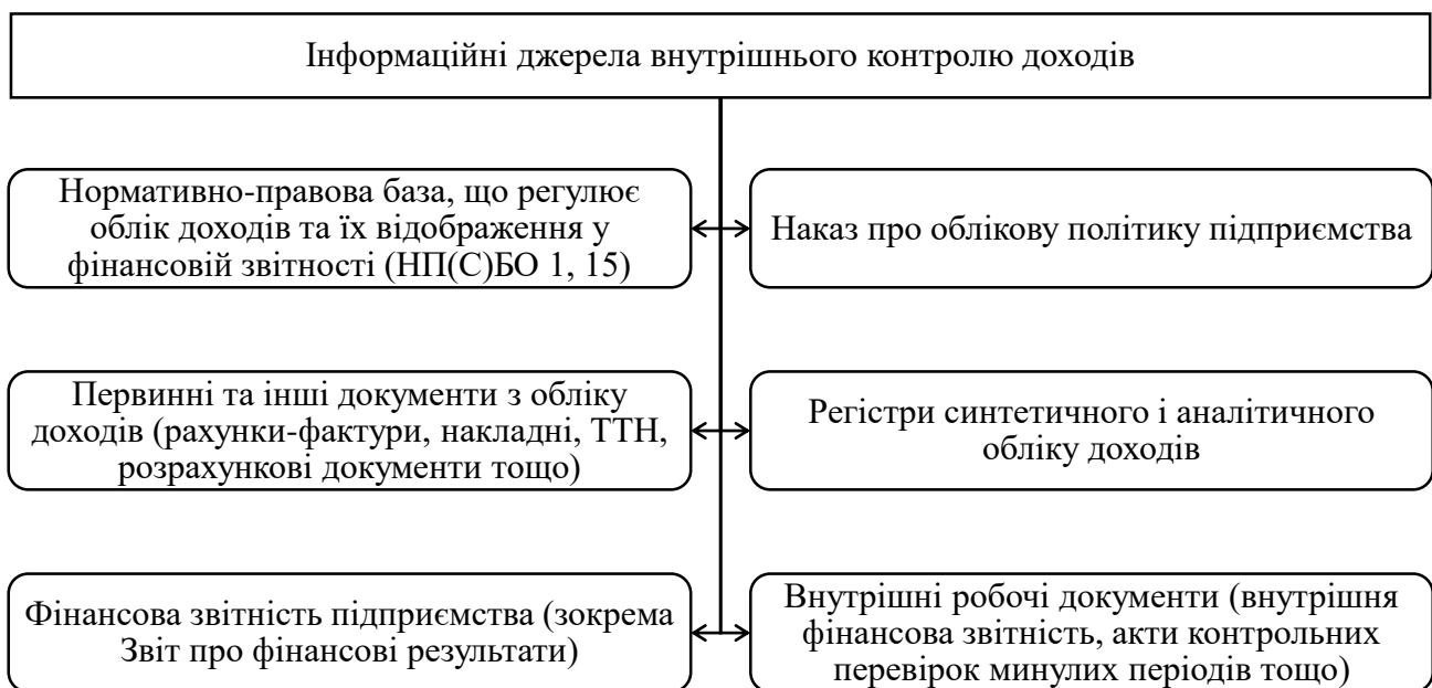
Рис. 1. Інформаційні джерела внутрішнього контролю доходів

Внутрішній контроль доходів відбувається за певною заздалегідь спланованою програмою внутрішнього контролю, яка включає в себе завдання, послідовність та сукупність його процедур. Слід зазначити, що об'єктами контролю доходів є безпосередньо доходи суб'єкта господарювання в розрізі їх видів, а також пов'язані з ними господарські операції. При цьому інформаційно-аналітичною базою для внутрішнього контролю складають наступні джерела (рис. 1).