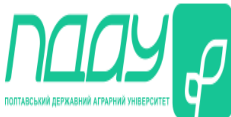
Полтавський державний аграрний університет