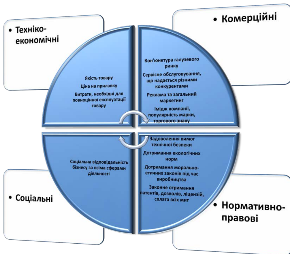
Рис. 1. Групи факторів конкурентоспроможності підприємств

В цілому ж, поняття конкурентоспроможність практично складається з чотирьох груп факторів (рис. 1).