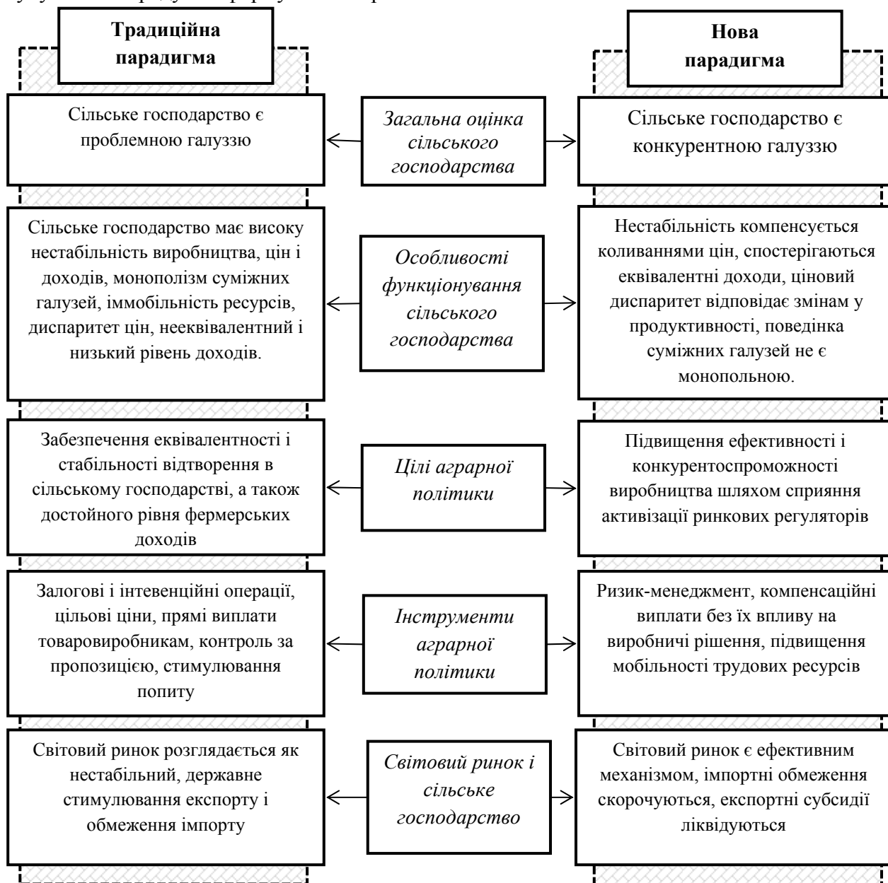
Рис. 1. Порівняльна характеристика традиційної та нової парадигми аграрної науки

наукового обґрунтування, що являється причиною великих помилок, що призводять до таких самих великих негативних наслідків [3, с.24]. Перш ніж сформувати наукову парадигму фінансової безпеки розвитку сільського господарства необхідно визначити сутнісні характеристики категорії «парадигма». За твердженнями деяких науковців, досліджувана категорія сформувалася завдяки Т. Куну, який, досліджуючи американську історію науки у праці «Структура наукових революцій» (1962), визначав, що «створення парадигми є свідченням того, що досягнута узгодженість щодо зразків дослідницької методології, яка знаходить свій вираз у виборі проблем дослідження, а також у сукупності теоретичних і методологічних передумов, які визначають напрям конкретних досліджень», тим самим прирівнюючи терміни «методологія» та «парадигма» та розкриваючи зміст останньої як сукупність передумов формування першої.