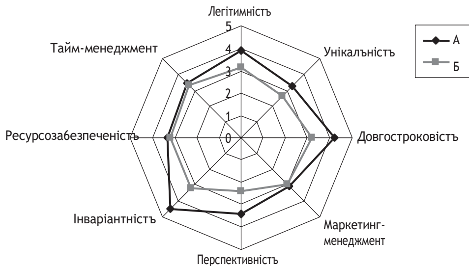
Рис. 1. Приклад оцінки конкурентних переваг потенційних партнерів