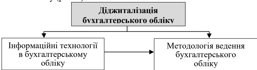
Рис. 1. Вплив діджиталізації на аспекти бухгалтерського обліку