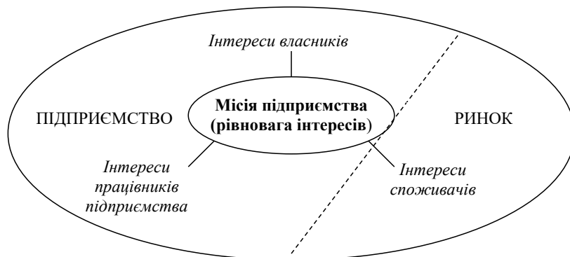
Рис. 1. Відносини ключових учасників ринкового середовища через місію підприємства

Між тим головним завданням місії є поєднання протилежних за змістом інтересів ключових учасників ринкового середовища: власників, споживачів та працівників. Власники найчастіше прагнуть отримати якомога більший прибуток від своєї діяльності, покупці – якісний продукт за нижчу ціну, а наймані працівники – максимально можливу заробітну плату (рис. 1).