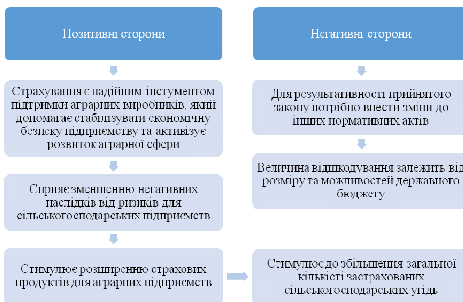
Рис. 2. Позитивні та негативні сторони Закону України №1601-IX

Одним з важливих інструментів в стратегіях управління ризиками є сільськогосподарське страхування, яке знову стає предметом інтересу, особливо для аграрних підприємств, які отримують фінансову допомогу з державного бюджету. Так, для стимулювання аграрного страхування український уряд прийняв ЗУ «Про внесення змін до деяких законів України щодо удосконалення правового регулювання страхування сільськогосподарської продукції з державною підтримкою» №1601-IX від 01.07.21 р., який набрав чинності 24.07.21 р. Основним завданням даного закону є удосконалення механізмів надання державної допомоги аграрним підприємствам шляхом страхування аграрної продукції. Проаналізувавши даний закон варто відзначити його позитивні та негативні сторони (рис. 2).