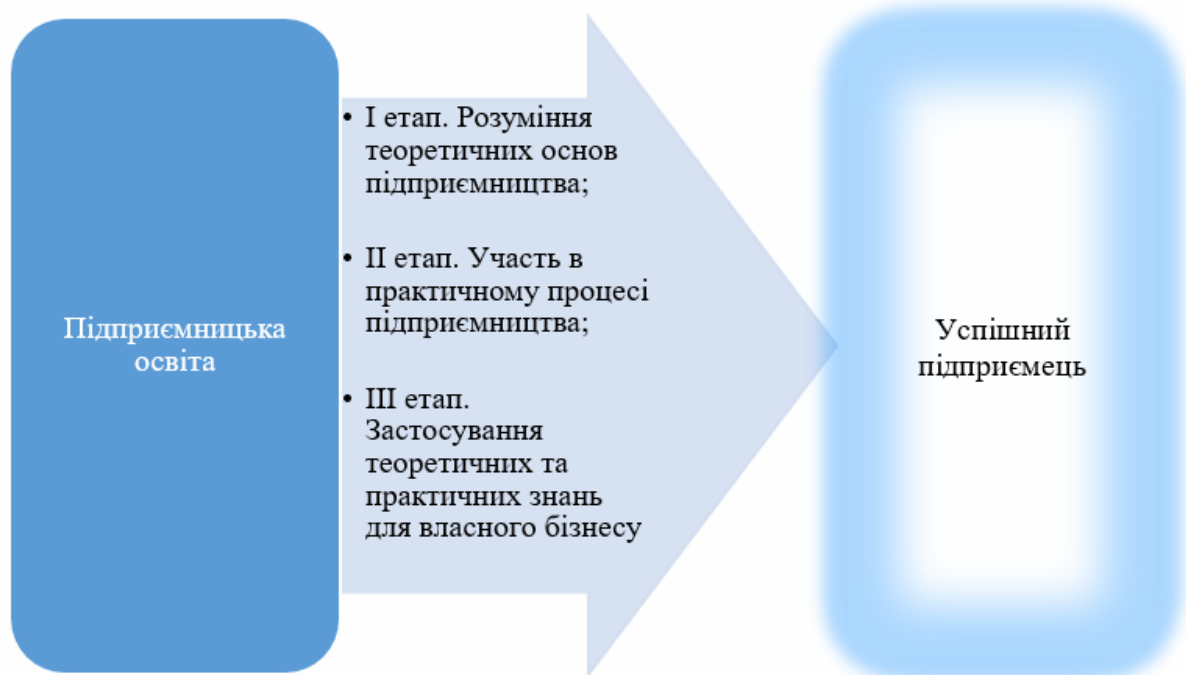
Рис. 2. Етапи отримання підприємницької освіти

Отримання підприємницької освіти складається з трьох етапів (рис. 2).