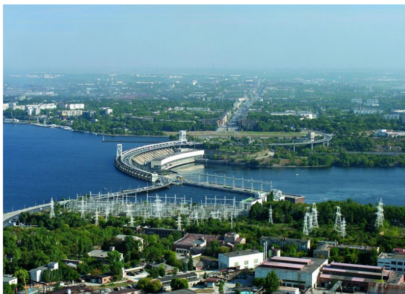
Рис. 1. Дніпровська ГЕС. Потужність – 1569 МВт. Висота греблі – 60 м. Запоріжжя.

Основна частина. Для визначення карбонізації та ступеню корозійного зносу арматури залізобетонних плит проїзної частини було виконано 18 місць розкриття конструкцій плит автопроїзду. Результати визначення карбонізації плит та визначення корозійного зносу арматури плит проїзної частини представлені у вигляді таблиці. На рис. 1, 2. показано загальний вигляд Дніпровської ГЕС