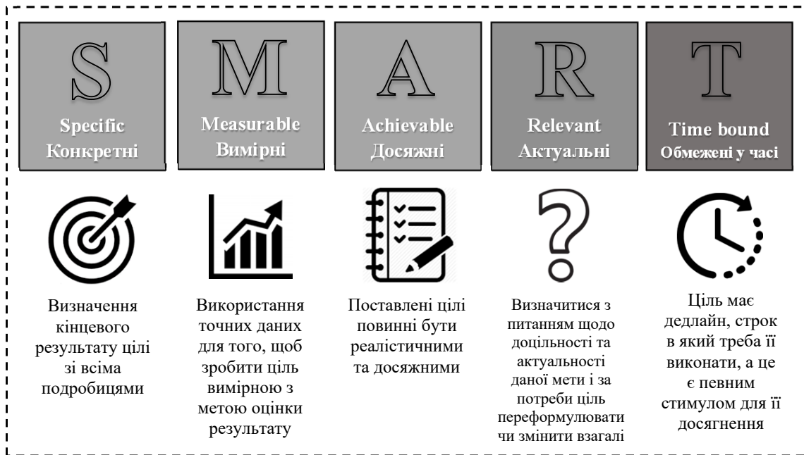
Рис. 1. Перелік SMART-критеріїв при формуванні завдань для досягнення поставленої мети щодо розвитку туристичної сфери