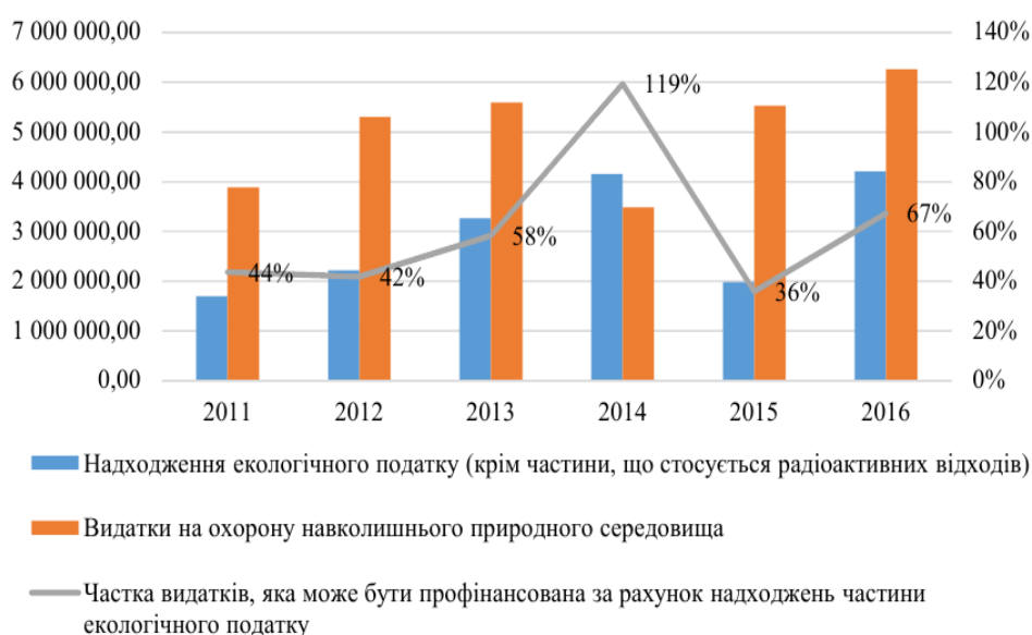
Рис. 3. Співвідношення витрат на охорону навколишнього природного середовища та надходжень від екологічного податку

Висновки. На основі систематизації методологічних підходів до вивчення системи землекористування виокремлено синергетичний підхід до парадигми сталого землекористування, запропоновано розглядати їх як процес кількісних та якісних перетворень, виражених економічними, екологічними та соціальними ефектами, що формує основи переходу аграрної сфери на етап сталого розвитку та виступає підґрунтям розбудови свідомого суспільства. Принципи парадигми сталого землекористування дають змогу сформулювати систему оцінки показників сталого роз-