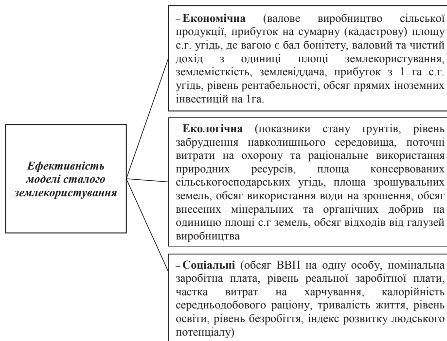
Рис. 2. Показники ефективності моделі сталого розвитку

забезпечення, зрошувані землі, займаючи 15% ріллі, забезпечують отримання 37,2% валової продукції рослинництва. На сучасному етапі розвитку аграрного виробництва в зоні Степу виникла потреба у формуванні структури посівних площ за умови виведення із складу ріллі схилових, засолених та інших малопродуктивних земель із метою уникнення подальшого погіршення їхнього меліоративного стану та зниження родючості [6, с. 92].