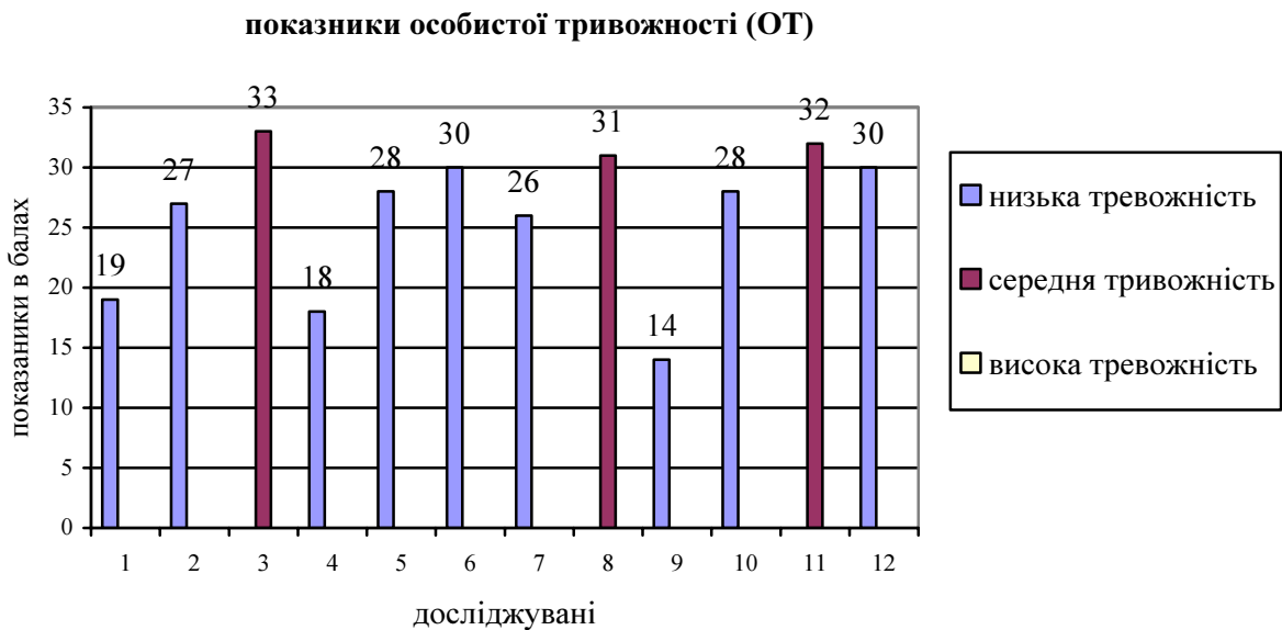
Рис. 1. Особистісна тривожність стрільців