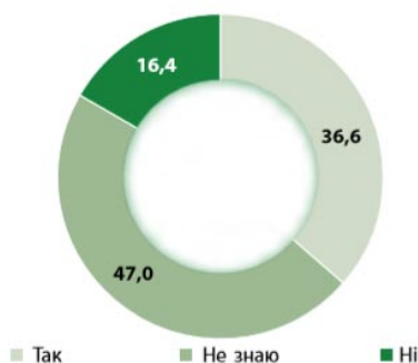
Рис. 1. Потреба в додаткових коштах, %