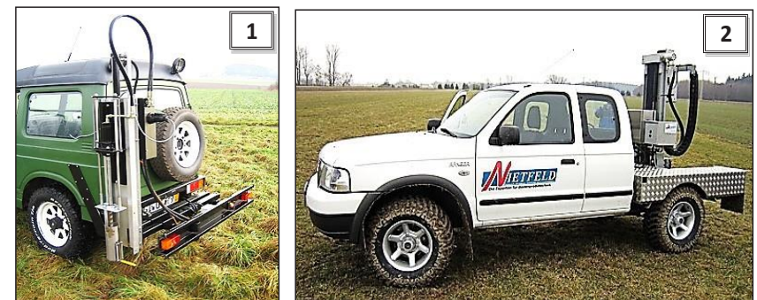
Рис. 3. Ґрунтові пробовідбірники: 1 – Niefeld 2005; 2 – Niefeld Duoprob 60

Використання мобільних автоматизованих комплексів. На сучасному етапі розвитку науки і техніки для відбору зразків ґрунту в передових господарствах України використовуються мобільні автоматизовані комплекси, обладнані автоматичними ґрунтовими пробовідбірниками Niefeld 2005 і Niefeld Duoprob 60 (рис. 3), бортовим комп'ютером, GPS-приймачем та спеціальним програмним забезпеченням. Використання таких технологій дає можливість проводити точний та автоматизований збір, аналізування і збереження якісної та кількісної інформації про ґрунтовий покрив земель, а також проводити контроль динаміки показників родючості ґрунтів кожного поля. На жаль, такі мобільні автоматизовані комплекси, внаслідок їх високої вартості, дозволити собі може далеко не кожне господарство.