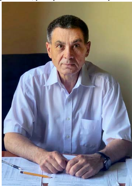
Ректор Чернівецького національного університету імені Юрія Федьковича проф. Роман Петришин

Маю надію, що найближчим часом будемо знову зустрічатися і продовжувати наше спілкування.