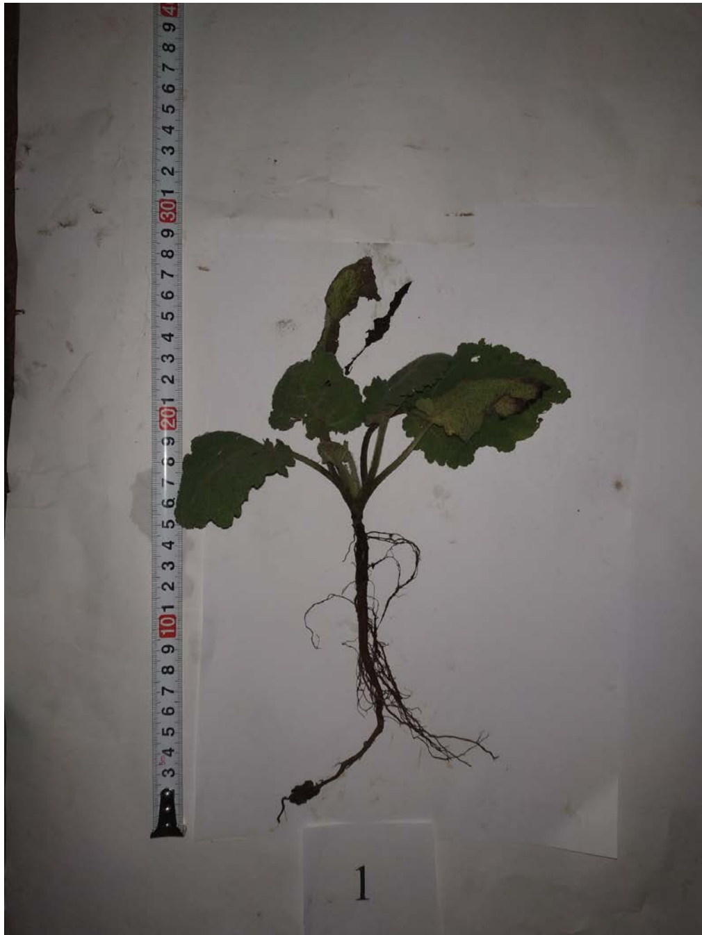
Рис. 6 Перший рік життя. Загальний вигляд шавлії мускатної, перший строк посіву без добрив, фаза розвитку рослин – сходи, (2012–2014 рр.)

На рис. 6 показано як інтенсивно розвиваються рослини без унесення добрив, слабо формуються біометричні показники, листовий апарат представлено тільки п'ятьма листочками, які за роками використання посіву формували врожай з низькими показниками як з урожаю сирі маси, так і ефірної олії у цьому варіанті досліджень.