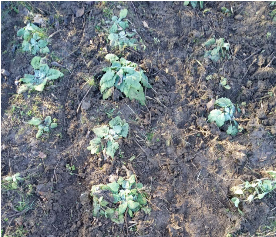
Рис. 5 Перший рік життя. Загальний вигляд посіву шавлії мускатної

Тому у відповідальний період розвитку рослин – сходи, особливу увагу слід приділяти підтриманню вологи в межах 70 – 75% НВ. У подальших періодах розвитку рослин ця особливість у підтриманні вологи у вище перерахованих межах відпадає.