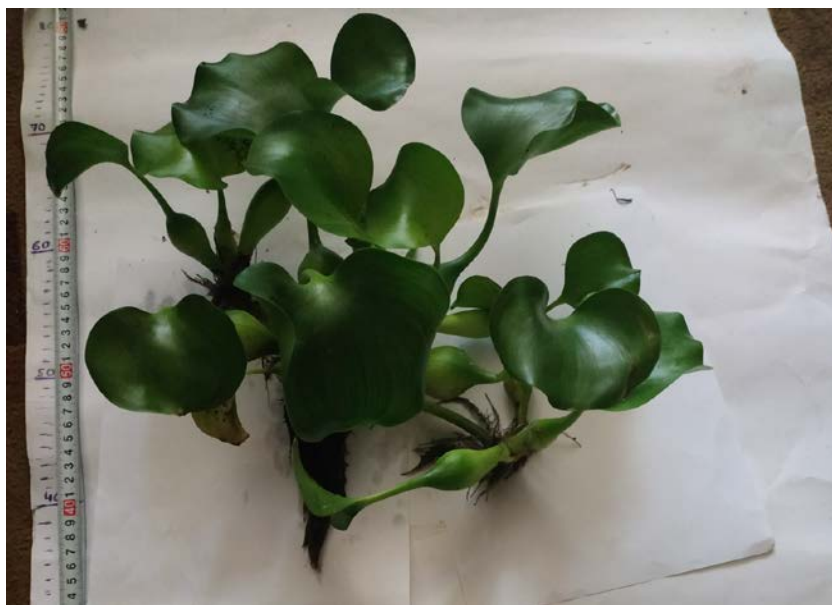
Рис. 10 Загальний вигляд ейхорнії товстоножкової до очищення водойми

Склад зеленої маси ейхорнії товстоножкової, що використовувалася для очищення стоків, в яку попали стічні води з ріки Дніпро, характеризувався досить високим вмістом вологи (94–88,9 %). Вміст протеїнів – 27,89–10,60 % і в перерахунку склав до 10–30 кг/т зеленої маси, азоту – до 20–35 кг/т, фосфору – до 17 кг/т. Зелена маса характеризувалася високим вмістом каротину – до 40 кг/т. Хімічний склад E.crassipes , що використовувалася у процесах очищення СВ (стічні воли), за умови, що у стоках не було важких металів, радіонуклідів, відповідає ДСТУ 4685:2006 «Корма трав'яні штучно висушені. Технічні умови».