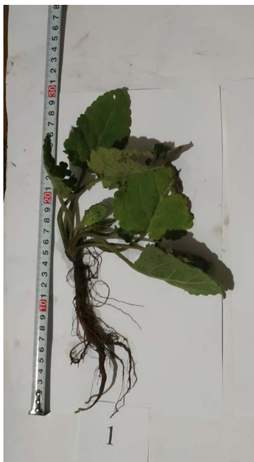
Рис. 7 Перший рік життя. Загальний вигляд шавлії мускатної, перший строк посіву, перша декада грудня, фаза розвитку рослин – сходи. Фон живлення N_{60}P_{90} , (2012–2014 рр.)

Відповідно до рисунка 7 надано загальний вигляд рослини шавлії мускатної на першому році життя з першим строком посіву – перша декада грудня, фаза розвитку рослини – сходи. Норма внесення добрив N_{60}P_{90} (2012–2014 рр.). На цьому рисунку коренева система має розгалужену систему, що дозволяла поглинати більшу кількість поживних речовин з ґрунту, фотосинтетична поверхня має більшу площу листового апарата, що сприяло формуванню в майбутньому більш високого врожаю біомаси та біологічно активних речовин у рослині.