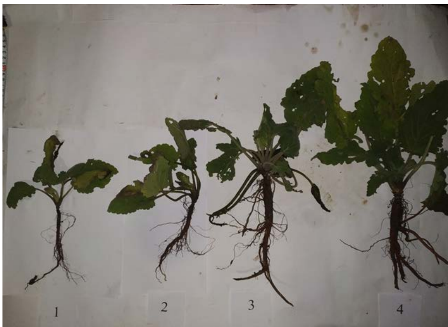
Рис. 4 Вплив досліджуваних факторів на формування біометричних показників шавлії мускатної першого року життя: 1 – Без добрив ; 2 – N_{60}P_{30} ; 3 – N_{60}P_{60} ; 4 – N_{60}P_{90}

проведенні краплинного зрошення. Перевага цього поливу перед дощувальними машинами різної конструкції в тому, що при краплинному зрошенні полив проводиться в рядок під рослину, водночас не зрошується міжрядковий простір, що зменшує появу бур'янів у міжряддях та призводить до зменшення кількості культиваций у міжряддях та покращення фізичних властивостей ґрунту.