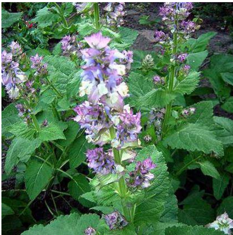
Рис. 1 Загальний вигляд рослини шавлії мускатної другого-четвертого років життя

(довжиною 2–3 мм), зростання (3–4 мм) і всмоктування, довжина якої значно коливається. На кінчику корінця чітко виражений чохлик. Зона поділу має гладку, без опушення, поверхню, зона всмоктування густо покрита тонкими кореневими волосками, кількість яких досягає 150–200 штук на 1 мм. Це свідчить про те, що рослина пристосована до умов недостатнього зволоження і низької забезпеченості ґрунту елементами живлення. Довжина корневих волосків досягає 2,0–2,5 мм. До появи сім'ядоль на поверхні ґрунту корінець поглиблюється на 10–16 см. Добовий приріст корінця в довжину складає 10–25 мм, водночас чітко виражена періодичність його зростання. Загальний вигляд рослини шавлії мускатної другого – четвертого років життя показано на рисунку 1.