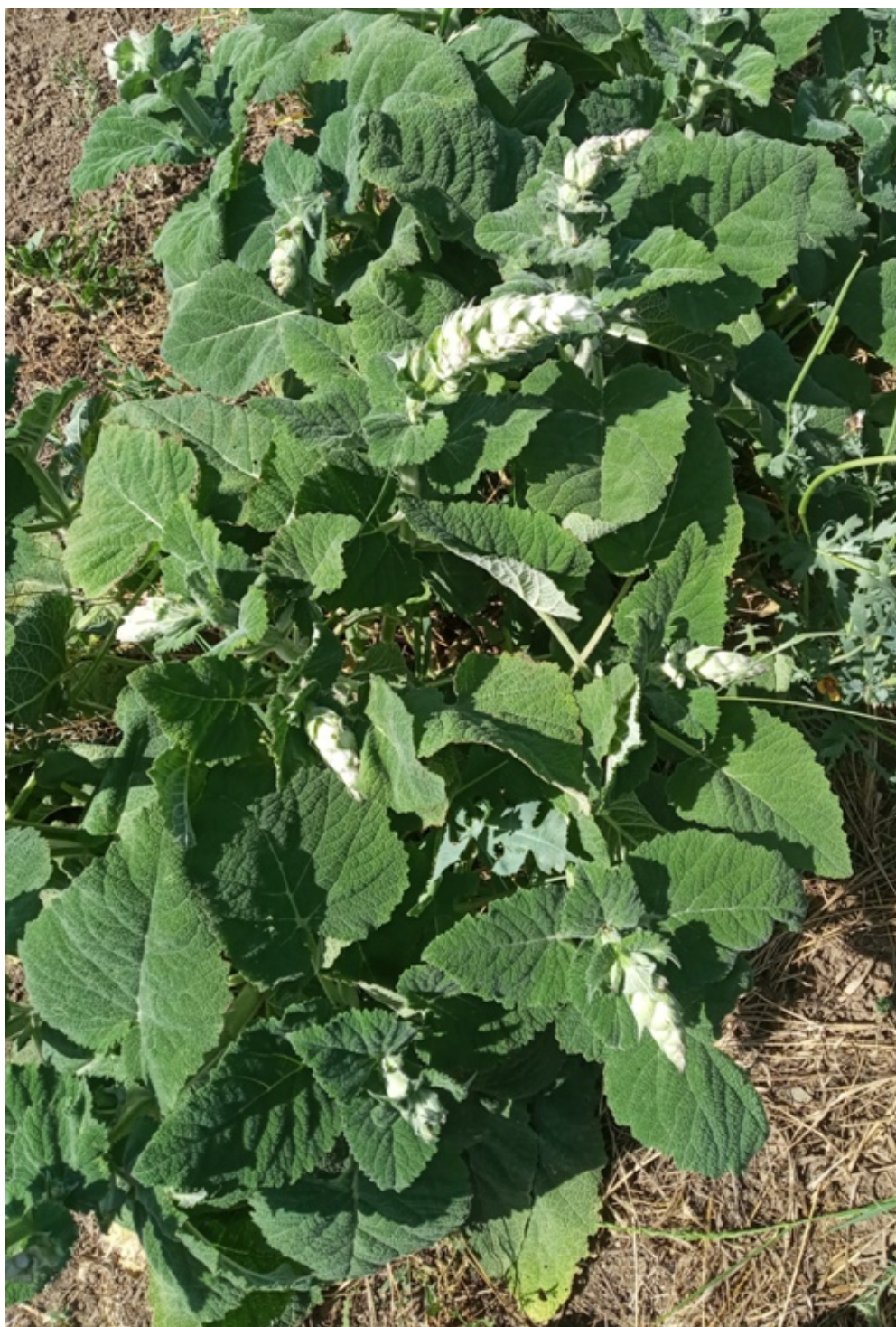
Рис. 8 Загальний вигляд шавлії мускатної четвертого року життя, третього року використання, фази бутонізації. Фон живлення N_{60}P_{90} , (2015–2017 рр.)

Загальний вигляд шавлії мускатної – фаза бутонізація, наданий на рисунку 9, ця фаза наступала відповідно до метеорологічних умов, які склалися в середньому з 4 по 10 червня 2015–2017 рр.