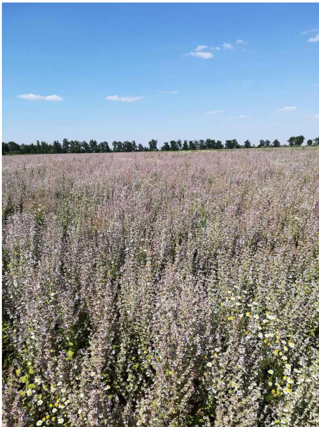
Рис.9 Загальний вид шавлії мускатної четвертого року життя, третього року використання у фазу цвітіння. Фон живлення N_{60} P_{90} , (20.06.2015 рік)