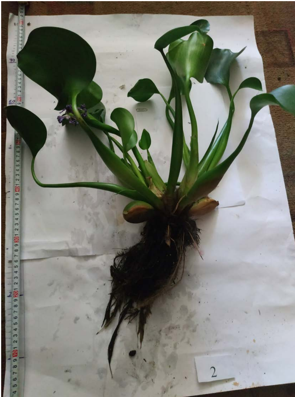
Рис. 11 Загальний вигляд ейхорнії товстоножкової після 60-денного перебування у забрудненій водоймі

Після вегетації рослин проводилося дослідження біологічних зразків ейхорнії, попередньо висушених до сухого стану, результати аналізів викладені у таблиці 4.1.5.