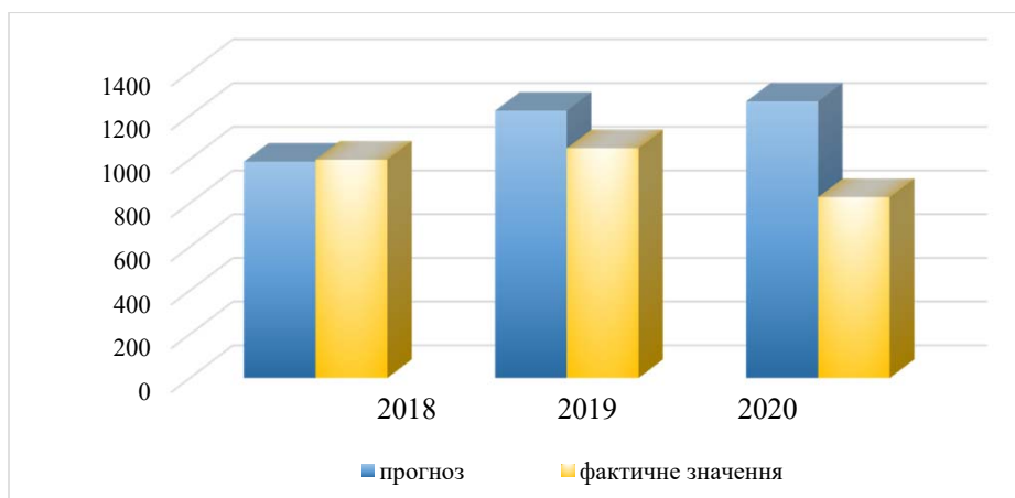
Рис. 3. Середньомісячний оптовий товарооборот оптових підприємств Херсонської області за 2018–2020 рр., млн грн