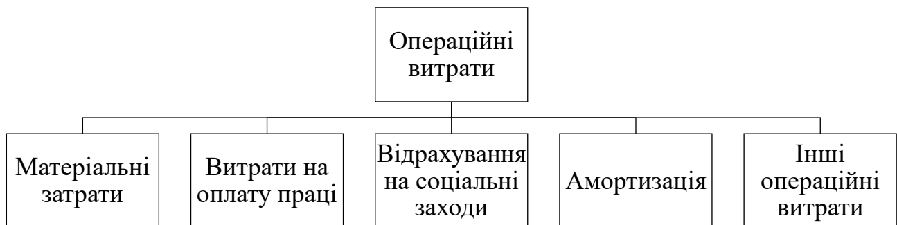
Рис. 1. Склад операційних витрат за елементами

Згідно з НП(С)БО 1 «Загальні вимоги до фінансової звітності» «витрати – це зменшення економічних вигод у вигляді зменшення активів або збільшення зобов'язань, що призводить до зменшення власного капіталу (за винятком зменшення капіталу за рахунок його вилучення або розподілення власниками)» [2]. Витрати, зокрема операційні, фермерські господарства обліковують за елементами у відповідності до П(С)БО 16 «Витрати» (рис. 1).