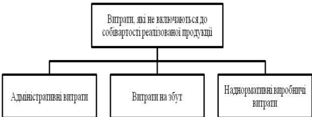
Рис. 2. Склад витрат, які не включаються до собівартості реалізованої продукції

Розглянемо витрати, які не включаються до собівартості реалізованої продукції (рис. 2).