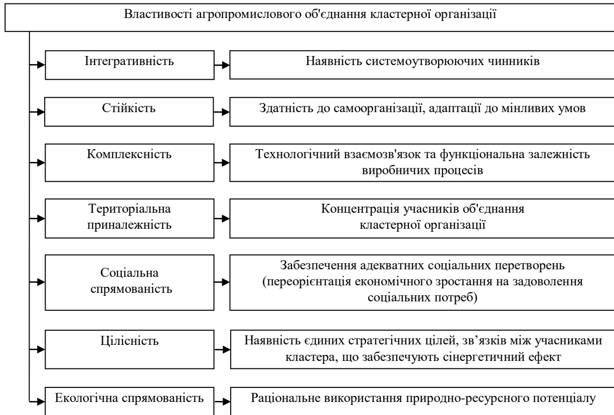
Рис. 2. Властивості агропромислового об'єднання кластерної організації

Властивості агропромислового об'єднання кластерної організації наведені на рис. 2.