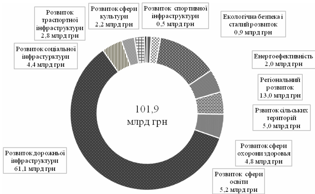
Рис. 1. Державна підтримка соціально-економічного розвитку територій у 2020 році, млрд грн. [17]

Тому із внесенням змін до Податкового та Бюджетного кодексів, від 1 січня 2015 року місцевим самоврядуванням отримано більше фінансів для підвищення економічної спроможності.