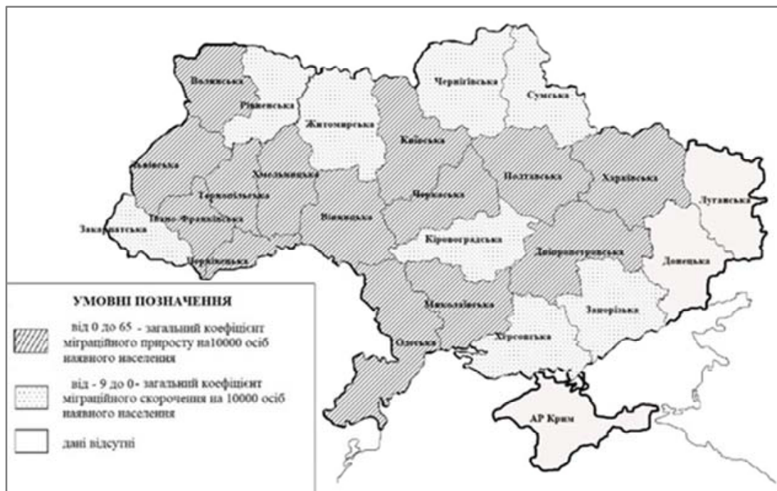
Рис. 1.22. Групування регіонів України за загальним коефіцієнтом міграційного приросту (скорочення) на 10000 осіб наявного населення у 2014 році