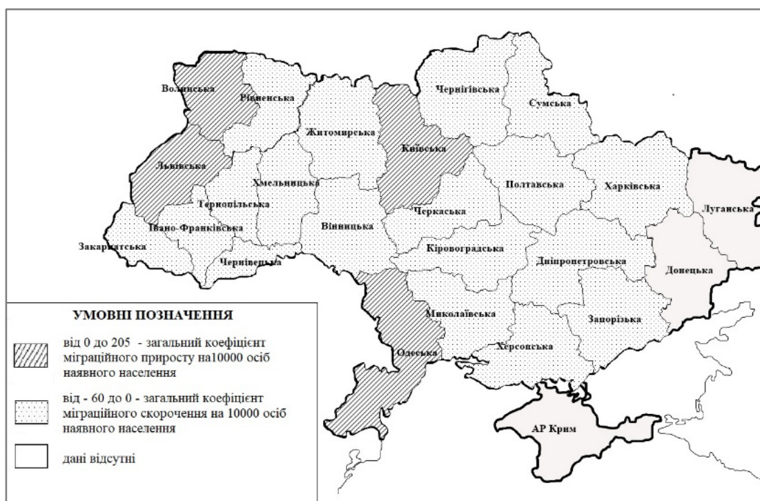
Рис. 1.23. Групування регіонів України за загальним коефіцієнтом міграційного приросту (скорочення) на 10000 осіб наявного населення у 2018 році