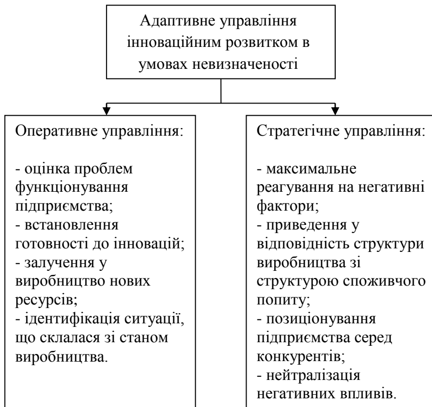
Рис. 3. Система адаптивного стратегічного управління інноваційним розвитком підприємства

На основі підвищення якості та конкурентоспроможності продукції пропонується поділ системи управління на ряд підсистем: