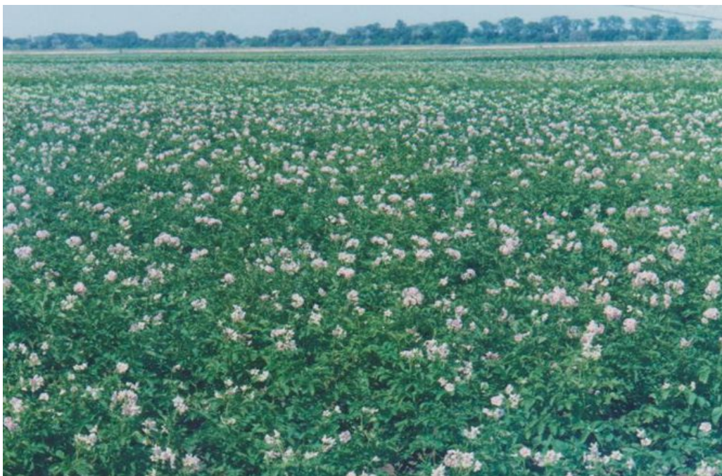
Рис.1. Дослідні ділянка з поливами краплинним способом, 2017 р.

Різні способи поливу неоднаково впливали на висоту рослин сорту Київський Світанок (рис. 1). Максимальна висота картоплі була відмічена у варіанті з краплинним зрошенням (49,7 см), а мінімальна (36,5 см) – у варіанті без поливів. Тобто застосування зрошення на картоплі підвищило висоту рослин у 1,23-1,1,36 рази.