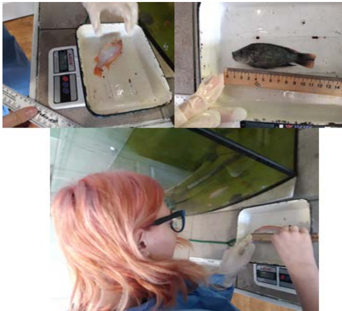
Рис. 2. Фрагмент здійснення морфо-метричної оцінки тияліпії Florida Red та Oreochromis mossambicus

Дослідження екстер'єрного профілю тияліпії за провідними індексами тілобудови показало, що в дослідній групі 2 параметри перевищували значення контрольної та дослідної групи 1. Крім того, коефіцієнт вгодованості в дослідній групі 2 перевищував контрольну та дослідну групу 1.