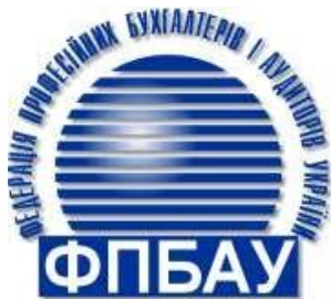
Федерація професійних та фінансів бухгалтерів та аудиторів України

МІНІСТЕРСТВО ОСВІТИ І НАУКИ УКРАЇНИ ПОЛТАВСЬКА ДЕРЖАВНА АГРАРНА АКАДЕМІЯ ДВНЗ «ПЕРЕЯСЛАВ-ХМЕЛЬНИЦЬКИЙ ДЕРЖАВНИЙ ПЕДАГОГІЧНИЙ УНІВЕРСИТЕТ ІМЕНІ ГРИГОРІЯ СКОВОРОДИ» НАЦІОНАЛЬНИЙ НАУКОВИЙ ЦЕНТР «ІНСТИТУТ АГРАРНОЇ ЕКОНОМІКИ» УКРАЇНСЬКА НАЦІОНАЛЬНА АКАДЕМІЯ АГРАРНИХ НАУК ФЕДЕРАЦІЯ АУДИТОРІВ, БУХГАЛТЕРІВ І ФІНАНСИСТІВ АПК УКРАЇНИ НАЦІОНАЛЬНА МЕТАЛУРГІЙНА АКАДЕМІЯ УКРАЇНИ СУМСЬКИЙ НАЦІОНАЛЬНИЙ АГРАРНИЙ УНІВЕРСИТЕТ ХАРКІВСЬКИЙ НАЦІОНАЛЬНИЙ ТЕХНІЧНИЙ УНІВЕРСИТЕТ СІЛЬСЬКОГО ГОСПОДАРСТВА ІМЕНІ ПЕТРА ВАСИЛЕНКА ХАРКІВСЬКИЙ ДЕРЖАВНИЙ УНІВЕРСИТЕТ ХАРЧУВАННЯ ТА ТОРГІВЛІ ДВНЗ «ХЕРСОНСЬКИЙ ДЕРЖАВНИЙ АГРАРНО-ЕКОНОМІЧНИЙ УНІВЕРСИТЕТ» ТОВ «БЕРДЯНСЬКИЙ УНІВЕРСИТЕТ МЕНЕДЖМЕНТУ І БІЗНЕСУ»