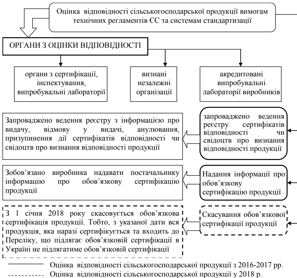
Рис. 2. Оцінка відповідності сільськогосподарської продукції вимогам технічних регламентів ЄС та системам стандартизації

Передбачається, що проведення оцінки відповідності може бути як добровільним, так і обов'язковим. Добровільна оцінка відповідності здійснюється в будь-яких формах, включаючи випробування, декларування відповідності, сертифікацію та інспектування, та на відповідність будь-яким заявленим вимогам.