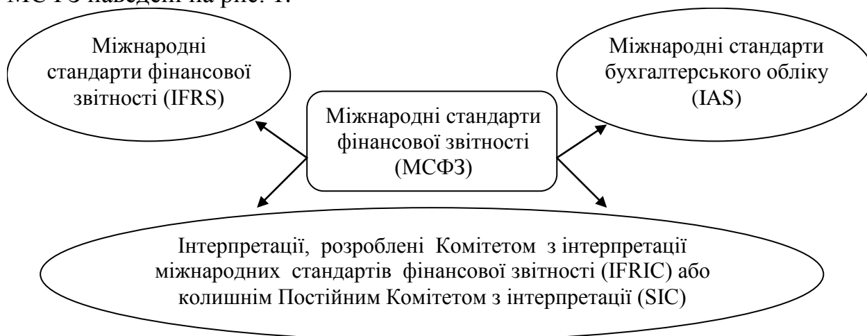
Рис. 1. Складові Міжнародних стандартів фінансової звітності

Сьогодні Міжнародні стандарти фінансової звітності (МСФЗ) обов'язкові для всіх суб'єктів господарської діяльності – в 91 країні світу, для частини суб'єктів – в 6 країнах, дозволені до застосування поряд з національними стандартами – у 25 країнах. При цьому в більшості країн звітність відповідно до МСФЗ зобов'язані готувати публічні компанії, цінні папери яких обертаються на відкритих торгах [1]. В Україні застосовуються МСФЗ та Національні положення (стандарти) бухгалтерського обліку. З 2012 р. Законом України «Про бухгалтерський облік та фінансову звітність в Україні» визначено Перелік суб'єктів господарювання, які зобов'язуються застосовувати МСФЗ, до яких належать: публічні акціонерні товариства; банки; страхові компанії; компанії наступних видів діяльності: надання фінансових послуг, недержавне пенсійне забезпечення; компанії, що надають допоміжні послуги у сфері фінансового посередництва та страхування. Міжнародні стандарти фінансової звітності (з англійської IFRS – International Financial Reporting Standards) широко використовуються в усьому світі. Вони є методологічною основою забезпечення зрозумілості та можливості порівняння для міжнародних інвесторів звітів суб'єктів господарської діяльності різних країн світу. Складові МСФЗ наведені на рис. 1.