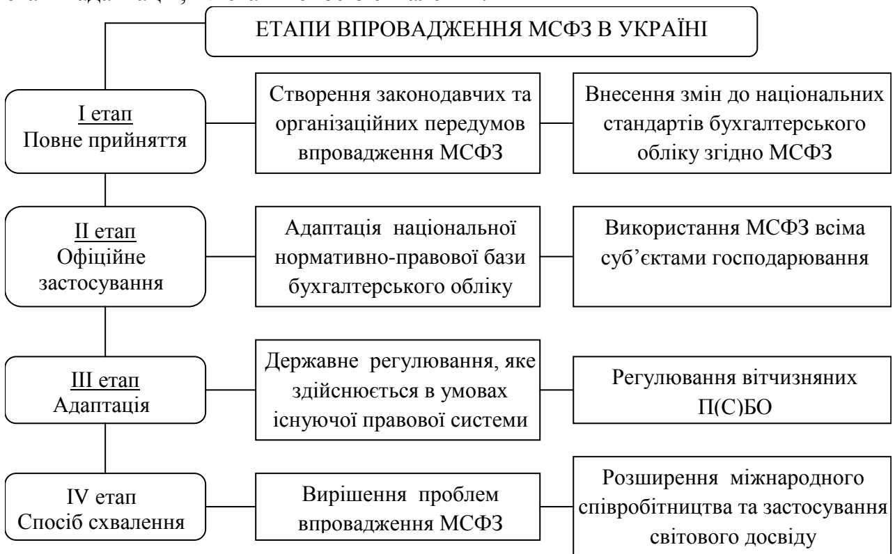
Рис. 2. Етапи впровадження МСФЗ в Україні

в Україні (рис. 2): I етап – повне прийняття; II етап – офіційне застосування; III етап – адаптація; IV етап – спосіб схвалення.