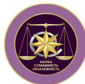
Кафедра обліку і оподаткування