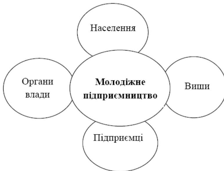
Рис.1. Взаємозалежність стейкхолдерів у розвитку підприємництва

З точки зору сучасних авторів, до стейкхолдерів можуть належати тільки ті організації, які не сприймають інтереси стейкхолдерів як обмеження. Деякі автори, відмічають, що в першу чергу зацікавлені сторони – це ті, які можуть впливати на процес прямо або опосередковано, по відношенню до них діє принцип взаємозалежності. Слід відмітити, що практично усі автори. Нами були виокремлені з позиції процесу розвитку молодіжного підприємництва основні групи стейкхолдерів (рис. 1).