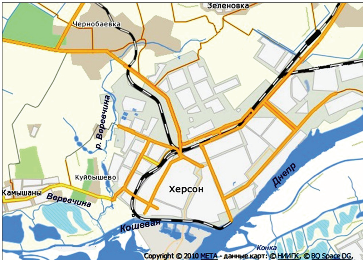
Рис. 1. Місце розташування р. Вирьовчини в межах м. Херсон

накопичилася в донних відкладах, представлених в нинішній час мулом із значним шаром детриту. Потужність мулів на гирловій ділянці становить 0,5-0,6 м, місцями збільшуючись до 0,8–1,0 м. Процеси розпаду органічних сполук у шарі мулів сприяють виділенню сірководню, підсилюють процес надходження забруднювальних речовин з мулу у водне середовище. Такі умови формують у водних масах р. Вирьовчина флору, яка має свої характерні особливості.