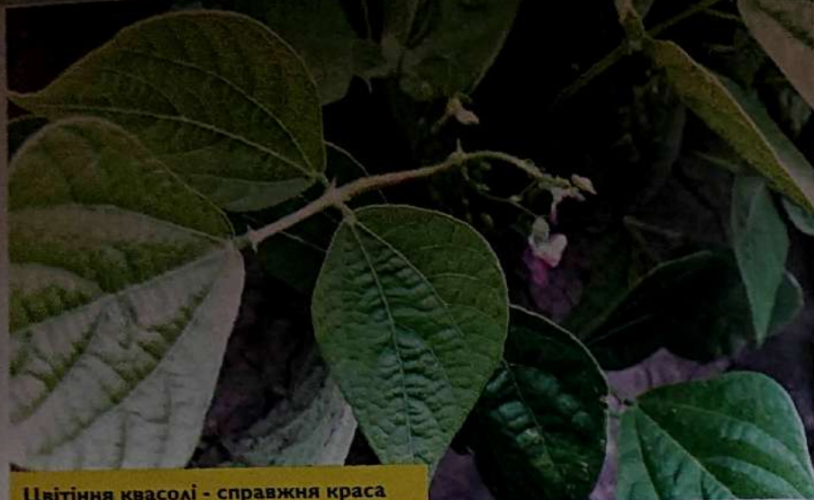
Цвітіння квасолі - справжня краса

Технологія вирощування квасолі була загальноновизнаною для умов Південного Степу України, за винятком факторів, які досліджували. Після збирання попередника (пшениця озима) проводили дворазове дискування стерні на глибину 6–8 та 10–12 см. Основний обробіток ґрунту виконували згідно схеми досліду. Під оранку вносили мінеральні добрива згідно схеми дослідів. Через два тижні з метою знищення бур'янів і вирівнювання ґрунту проводили суцільну культивування на глибину 12–14 см. Весною при настанні фізичної стиглості ґрунту проводили боронування БЗСС-1,0. Передпосівну культивування виконували на глибину загортання насіння. Сівбу виконували на глибину 5–7 см трактором МТЗ-80 з сівалкою СЗ-5,4 «Акорд» нормою 400 тис./га схожих насінин. Насіння за 1–2 години до сівби обробляли біопрепаратами високоефективних штамів бульбочкових бактерій. Після сівби до сходів куль-