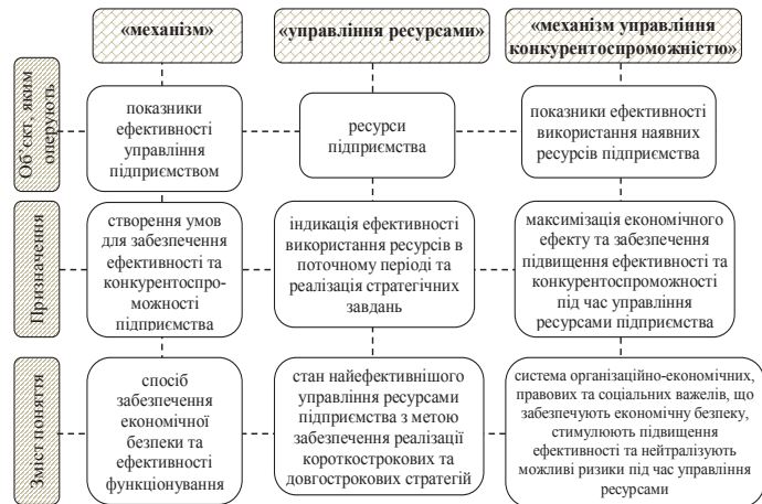
Рис. 3. Семантична характеристика поняття «механізм управління конкурентоспроможністю»

Наведені дані надають можливість встановлення логічного зв'язку між дефініціями «механізм» та «управління ресурсами підприємства», що виражається в їх послідовній залежності, тобто останнє є похідним від попереднього. Своєю чергою, механізм є інструментом досягнення максимальної ефективності під час управління ресурсами агроформувань.