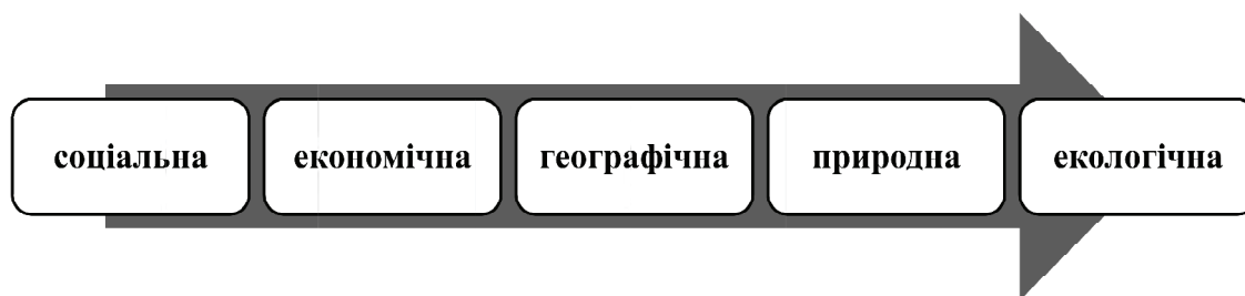
Рис. 1. Вектор формування компонентної складової державної політики у сфері забезпечення соціально-економічне зростання сільських територій на засадах концепції "Leader"

гіонального управління, необхідних для розвитку сільських територій в Україні тощо.