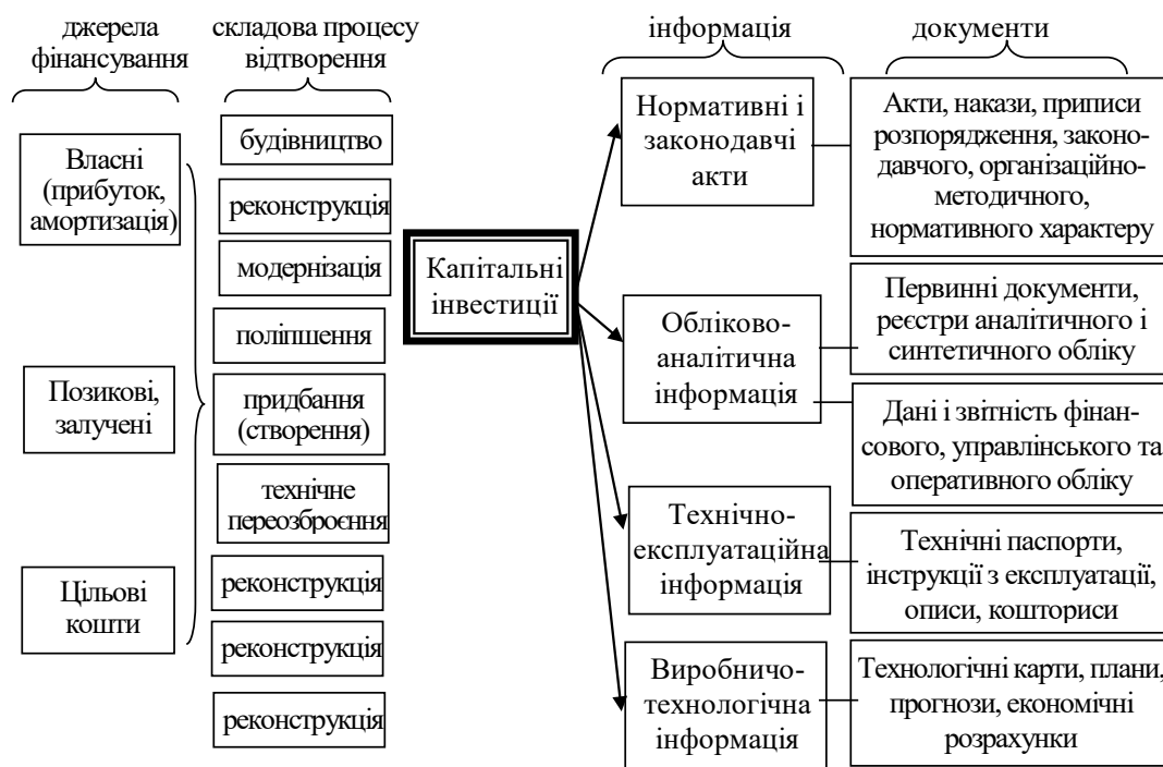
Рис. 3. Облікове забезпечення капітальних інвестицій у процесі управління відтворенням

вкладень. Оскільки фінансове навантаження на підприємство за різних форм капітальних вкладень істотно відрізняється, найчастіше вибирається технічне переозброєння, орієнтуючись на такий підсилюючий фактор, як короткі терміни окупності вкладень.